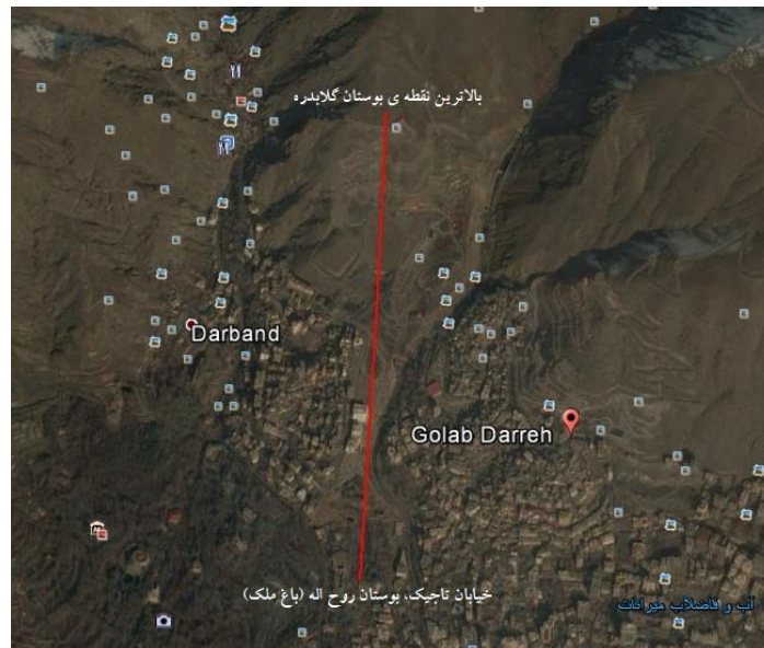
تصویر شماره ی ۸: مسیر اختصاصی برای تله سیژ