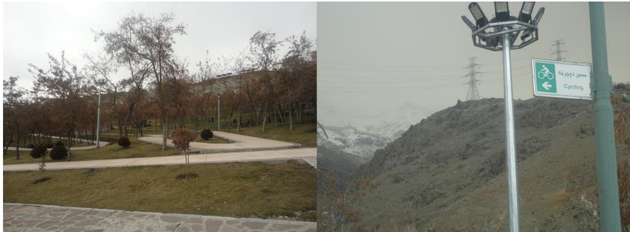
تصویر شماره ۷: نمایی از مسیر دوچرخه سواری

همچنین وجود مسیر صاف برای دوچرخه سواری و دویدن درون بوستان از مزیت‌های بوستان گلابدره می‌باشد که به افراد این امکان را می‌دهد از پیاده‌راه‌های درون بوستان استفاده‌ی بهینه را بنمایند.