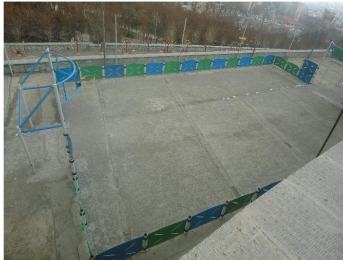
تصویر شماره ۲: زمین بسکتبال داخل بوستان

بهبود و وضعیت زمین ورزشی داخل بوستان: همانطور که در تصویر شماره ۲ م مشاهده می کنید زمین بسکتبال داخل بوستان حداقل امکانات امنیتی را برای استفاده افراد ندارد و افرادی که می خواهند از این زمین استفاده می کنند امکان دارد دچار سانحه شوند و در نتیجه میزان استفاده از آن کاهش می یابد. مسئول تجهیز و ایمن سازی این فضا در ابتدا معاونت امور شهری و فضای سبز شهری منطقه ی یک شهرداری است که با نظارت خود و اعلام به شرکت پیمانکار طرح بوستان گلابدره به تغییر وضعیت زمین بازی فوق پردازد.