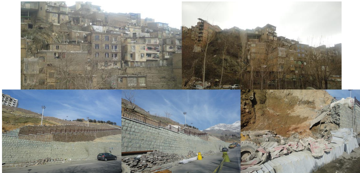
تصویر شماره‌ی ۴: نمایی از منازل مجاور ضلع شرقی بوستان

در ضلع جنوبی بوستان از سمت خیابان تاجیک مسیری در حال ساخت می‌باشد که مسیر فوق به صورت رمپ می‌باشد. اما باید این امر در نظر گرفته شود که این ورودی به سمت بوستان از پارکینگ پایین تر می‌باشد و افرادی که قصد رفتن به بوستان با و سایل نقلیه خود را دارند باید ابتدا به پارکینگ و سپس به سمت ورودی بیایند که این با وجود اینکه مسیر را برای پیاده‌روی فراهم می‌کند برای افراد کم توان مشکل ساز است.