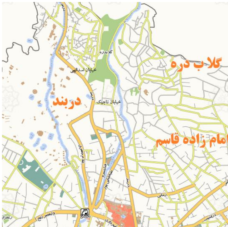
تصویر شماره ۱: محل قرار گیری بوستان گلابدره

بوستان گلابدره واقع در ناحیه‌ی ۳، منطقه‌ی یک شهرداری تهران به نشانی میدان تجریش، خیابان فناخسرو، خیابان دربند، نرسیده به میدان دربند، کوچه اسدالهی، سمت راست، بعد از سازمان آب بوستان جنگلی گلابدره و یا میدان تجریش، خیابان فناخسرو، خیابان دربند، نرسیده به میدان دربند، خیابان تاجیک، سمت راست، خیابان گلابدره، پارکینگ اختصاصی بوستان جنگلی گلابدره می‌باشد.