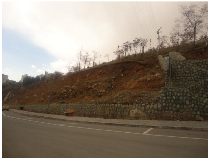
تصویر شماره ۱: نمایی از قسمتی که می‌توان برای ساخت بالابر استفاده نمود.

است، بالابر ساخته شود تا تمامی شهروندان با هر گونه شرایطی امکان استفاده از بوستان را داشته باشند. این امر باید توسط اموری شهری و فضای سبز منطقه و گروه مشاورین فنی در معاونت امور شهری قابل پیگیری است.